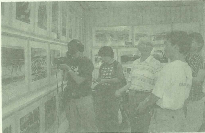
張醫師（左三）的每幅作品，似乎都蘊藏豐富的生命力，撼動人心。

張醫師坦言道，當初選擇唸醫科其實是父親的期望，自己卻對醫生行業沒多大的興趣，但他仍是認真的當了一位人人稱道的好醫生。真正讓張醫師著迷的是科技方面的事物；從學生時代，就偏好數學、物理的他，只憑著一份好奇與喜愛，買零件拼出自己的第一架收音機，在小坪頂還尚未有電力供應，收音機尚未普及的30年代，上電池的收音機成了最時髦的玩意兒！而陸續發展的錄音機、音響、擴大器，他亦發揮自身在機械方面的天賦，走在裝組電器潮流的先端；有趣的是，在大學時代，也因為愛好拼裝電器，讓房東先生一直以為他是讀電機系的，壓根兒也沒想到是醫學院的高材生，讓人跌