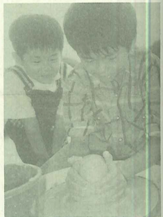
報名玩陶土的小朋友拉坯架勢十足，一點也不輸大人

由三商人壽主辦之鳳翔盃親子寫生，於10月31日下午兩點到五點，假淡水捷運站後河濱公園熱鬧開鑼。此次活動共有一千五百多名學童報名參加，吸引不少遊客佇足欣賞。另外，本會亦在現場配合舉辦「陶藝雅集」活動，邀集十數位淡水地區陶藝家展示作品，並進行「親子玩陶」、「拉坯教作」等教學，讓報名參加的大、小朋友們親自感受玩陶之樂，將完成的作品帶回去留念，場面熱絡而活潑。