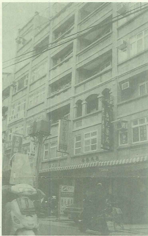
期待重建後的老街，能充分現代化使用並保留傳統街區特色