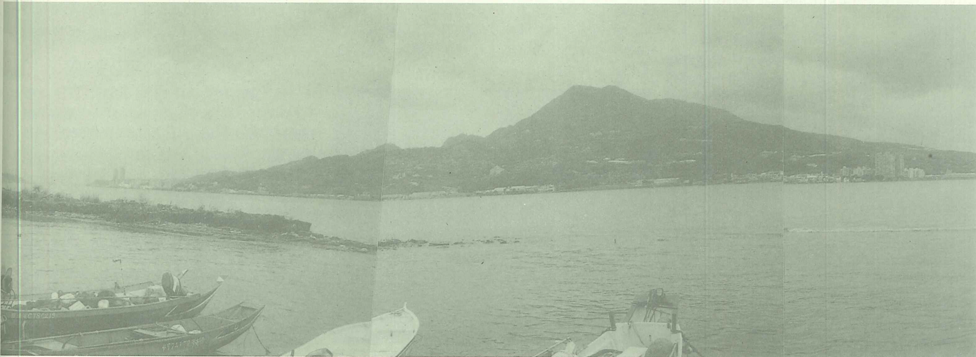
母親之河—淡水河、包容多元而豐富的生命。

生命本為多元，多元生命就是美。多元帶來富裕、健康、和諧，更帶來對前途的無限期許。這是咱的本性，咱的責任，是歷史的洪流，是臺灣人前行邁進的不歸路，是咱的前程，咱的真理。